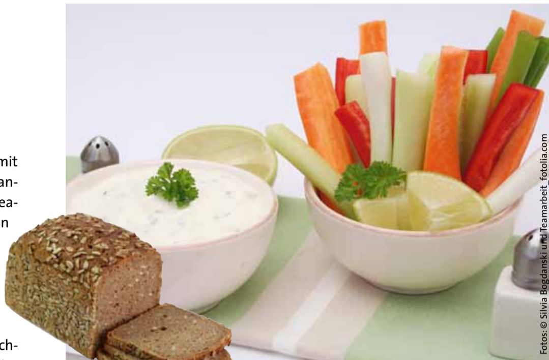
Täglich auf den Tisch: Vollkornprodukte und Rohkost

Es bringt mehr, dreimal wöchentlich eine Stunde zu wandern als einmal drei Stunden. Wer bereits unter Durchblutungsstörungen als Spätfolgen der Zuckerkrankheit leidet, muss vor dem Bewegungsprogramm mit dem Arzt sprechen. Reichen diese Bewegungsmaßnahmen nicht aus, werden zunächst Tabletten (orale Antidiabetika) gegeben und erst als letzte Maßnahme Insulin gespritzt.