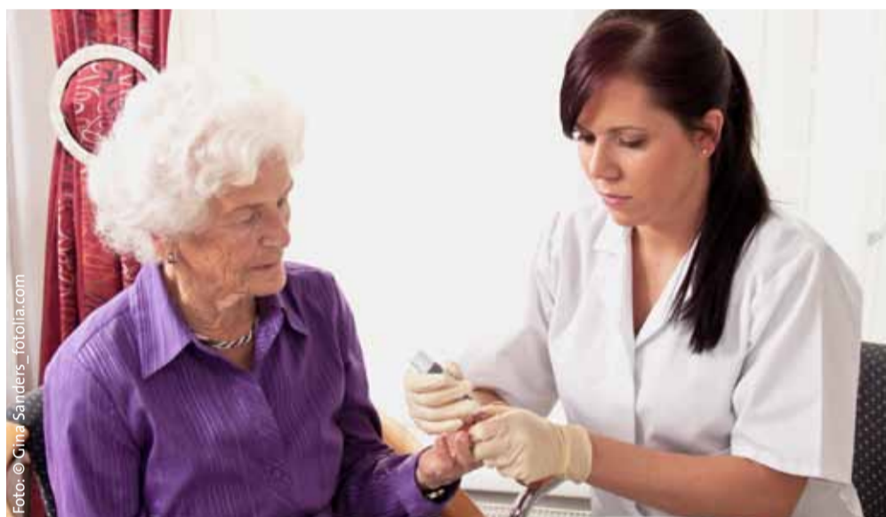
Den regelmäßigen Blutzuckertest macht die Sozialstation.

kommt. Bei sportlichen Aktivitäten geht es um Ausdauertraining wie Wandern, Walken, Schwimmen, Joggen, Ballspiele und Gymnastik. Wichtig ist die Regelmäßigkeit: