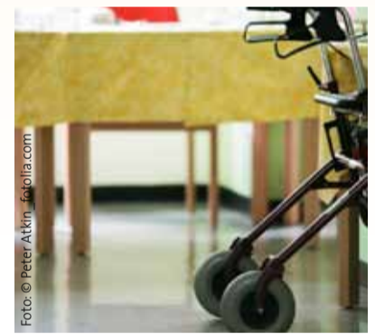
Rollatoren sind heute kleine Multiköner.

werden wir auch mit Herstellern und Forschungseinrichtungen zusamen- arbeiten, die an unserem praktischen Blick auf die Dinge interessiert sind. Durch unsere lange Erfahrung in der häuslichen Pflege wissen wir: DEN alten Menschen gibt es nicht, DEN Pflege-